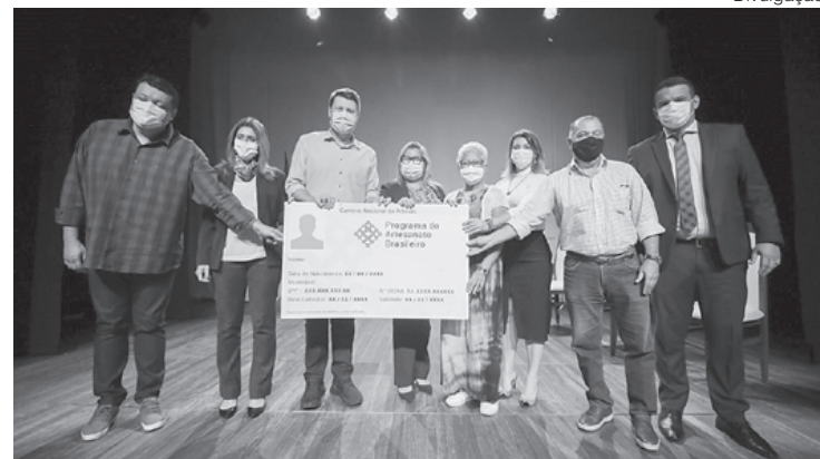
Documento garante a possibilidade de microcrédito com a AgeRio, desconto para a compra de matéria prima, cursos de qualificação, entre outros benefícios

– Quero lembrar que o cadastro está sendo realizado em formato online. É necessário cumprir todas as eta-