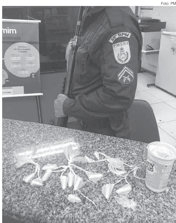
Suspeito estava com 14 pinos de cocaína dentro de um copo plástico

A apreensão do material foi feita por policiais militares do Destacamento de Policiamento Ostensivo (DPO), de Vista Alegre. Os agentes não conseguiram