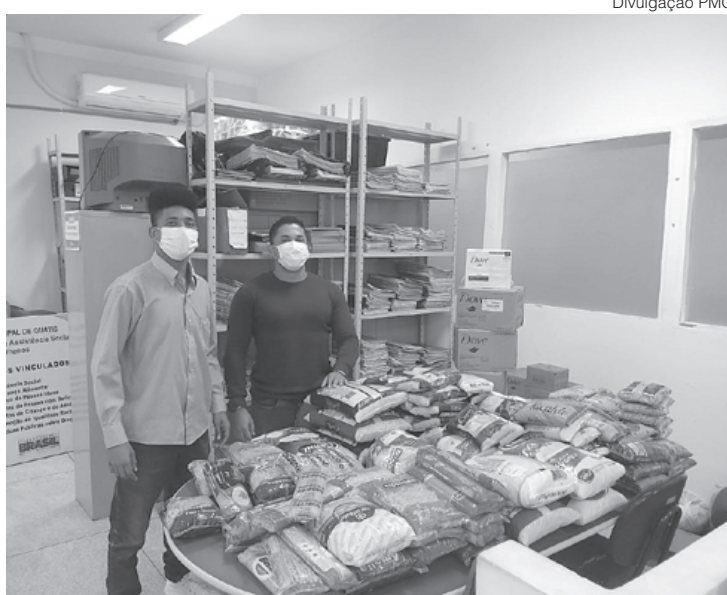
Campanha já arrecadou uma tonelada de alimentos que são destinados às famílias do município

Segundo o presidente do NAC, pelo menos quatro mil famílias de Volta Redonda serão beneficiadas com as doações de alimento. As famílias contempladas estão registradas em um cadastro reunido pelas instituições sociais do município para evitar que uma família receba a mais ou a menos do que as outras.