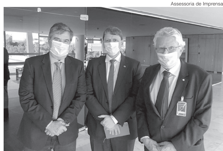
Ministro (no centro) visitará o Pátio de Manobras na próxima segunda-feira

A obra de readequação ferroviária de Barra Mansa compreende uma extensão de 4,84 km de corredor ferroviário no perímetro urbano, incluindo ainda cerca de 5,7 km de vias urbanas adequadas, reconstruídas ou implantadas e pavimentadas. No momento, os pilares para a construção da passarela de pedestres em frente ao Parque da Cidade já foram erguidos, além de outra passarela próxima à Prefeitura. A obra além de revitalizar o centro do município, proporcionará mais segurança para os morado-