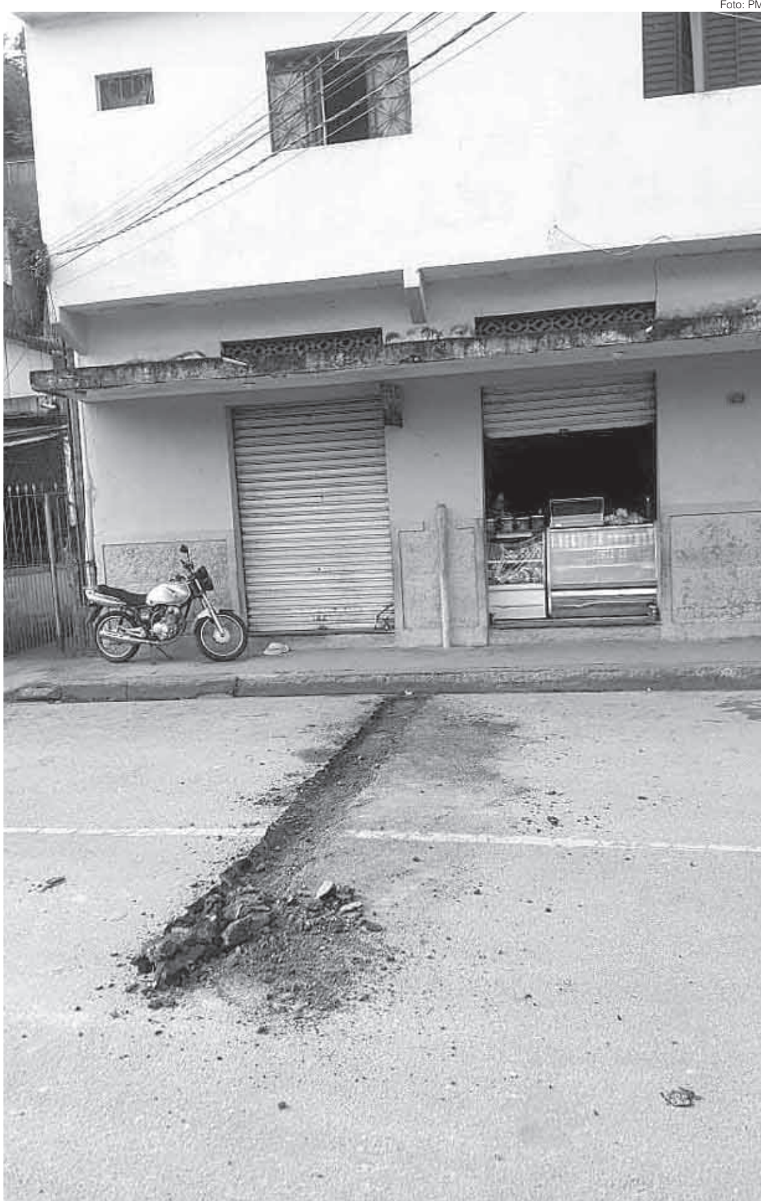
Objetivo do homem era impedir a circulação de viaturas da PM na localidade

O suspeito foi levado para a 90ª DP (Barra Mansa), onde foi indiciado no crime de associação para o tráfico de drogas.