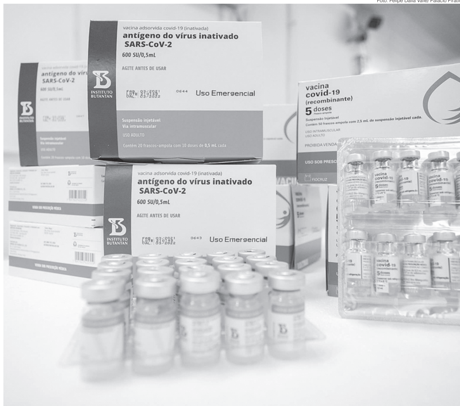
Nesta quinta, estados começam a receber novos lotes de imunizantes para ampliar ainda mais a campanha de vacinação contra a Covid-19

Até o dia 12 de maio, mais de 48 milhões de doses já foram aplicadas. O andamento da vacinação no país pode ser acompanhado pela plataforma LocalizaSUS.