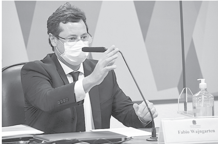
Fabio Wajngarten, ex-secretário de Comunicação da Presidência da República, depôs nesta quarta-feira, dia 12, à CPI da Pandemia

O ex-secretário de Comunicação da Presidência da República Fabio Wajngarten declarou à CPI da Pandemia nesta quarta-feira, dia 12, que a campanha “O Brasil não pode parar”, produzida em março de 2020, circulou sem autorização. No entanto, ele foi acusado de mentir sobre o endosso do governo ao tema.