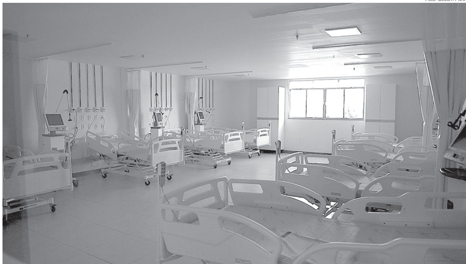
Acordo com o UniFOA vai ampliar atendimento no Hospital do Retiro